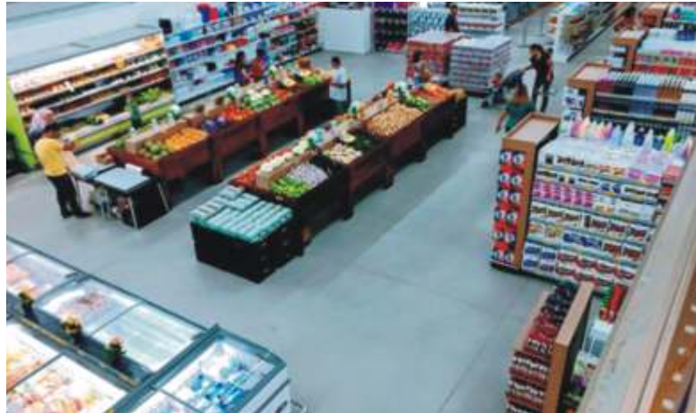
Inauguração da nova loja do Supermercado Real no Jardim Panorama