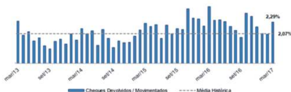
Gráfico 1 - Cheques devolvidos / Cheques movimentados

O gráfico 1 mostra a evolução recente dos dados citados