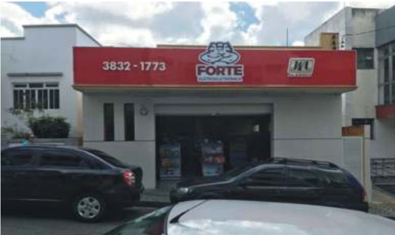
Inauguração da Empresa Forte Eletroeletrônica situada à Rua João Pinheiro, 89

Estamos divulgando neste espaço, os novos empreendimentos que estão sendo iniciados em nossa cidade, bem como as mudanças e/ ou melhorias realizadas nas empresas campo-belenses. A finalidade é valorizar as empresas de nosso município e ao mesmo tempo agradecer a confiança destas na economia local.